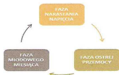
rys. nr 1 Cykle przemocy