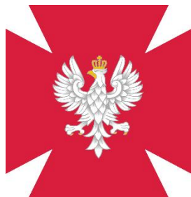
Chorągiew Wojska Polskiego

Rotmistrz Witold Pilecki ps. „Witold”, „Druh”, ur. 13 maja 1901 w Ołońcu, zm. 25 maja 1948 w Warszawie. Pochodził z rodziny szlacheckiej herbu Leliwa, od 1910 r. zamieszkali w Wilnie, od 1914 r. należał do harcerstwa. Rotmistrz kawalerii Wojska Polskiego, współzałożyciel Tajnej Armii Polskiej, żołnierz Armii Krajowej. Był dobrowolnym więźniem obozu w Oświęcimiu pod jednym z konspiracyjnych nazwisk – „Tomasz Serafiński”; specjalnie dał się złapać, by dla polskiego podziemia zbierać informacje o obozie Auschwitz i zorganizować ruch oporu. Autor raportów o ludobójstwie, tzw. Raportów Pileckiego. Oskarżony i skazany przez władze komunistyczne Polski Ludowej na karę śmierci, stracony w 1948. Unieważnienie wyroku nastąpiło w 1990. Pośmiertnie, w 2006 odznaczony Orderem Orła Białego, a w 2013 został awansowany na stopień pułkownika. Witold Pilecki to jedna z ikon polskości w XX wieku.